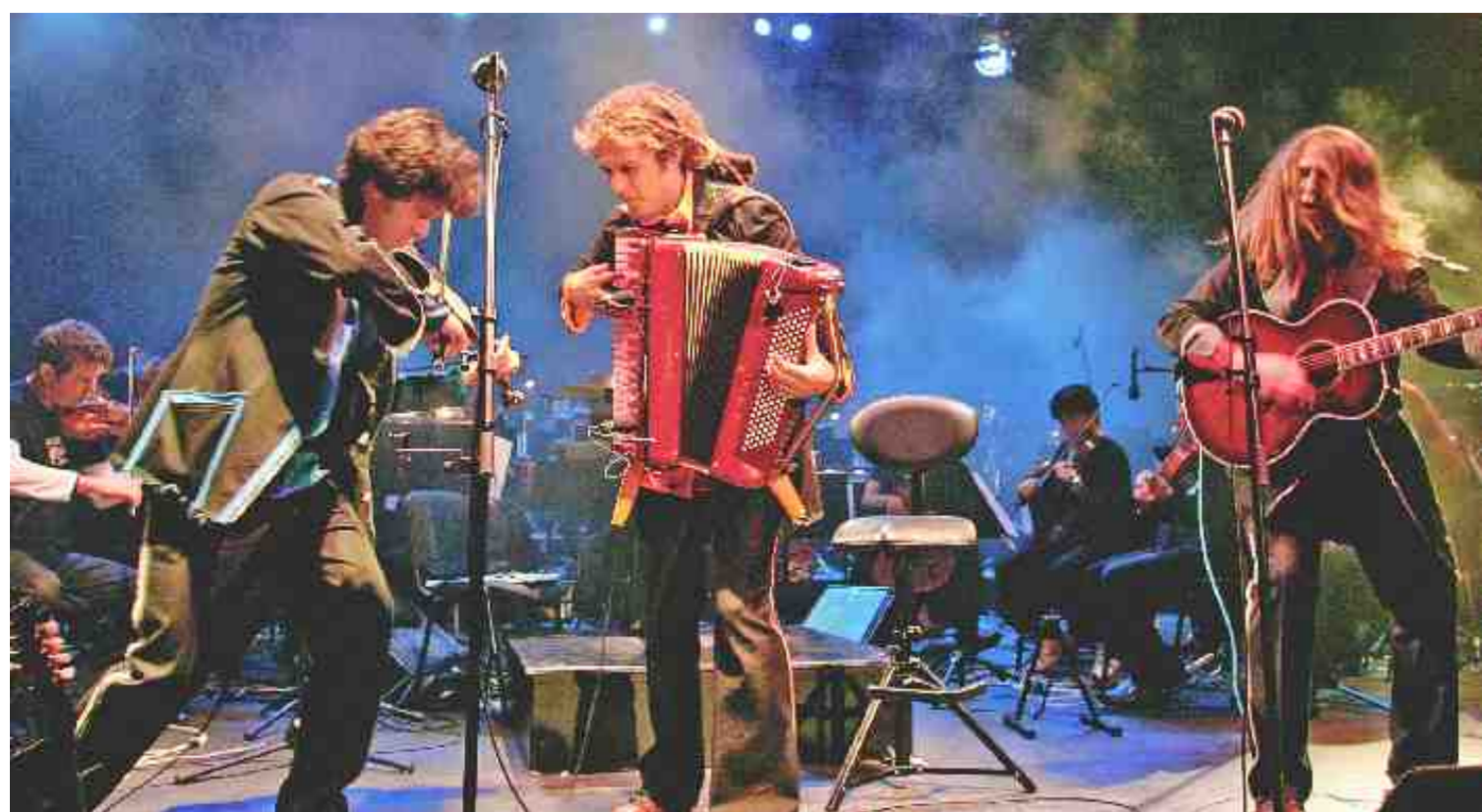
(NE)KAKOVOSTNA KULTURA – Skupina Terrafolk je 13. in 14. 9. 2005 razprodala koncerta s simfoniki RTV Slovenije v ljubljanskih Križankah.

Vrednost kulture se določa s subvencijami